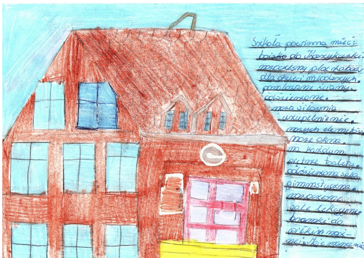
rys. Roksana, kl. 6a

„Szkoła powinna mieć: boisko do koszykówki, bramki do piłki nożnej, nowoczesny plac zabaw dla dzieci młodszych, nową siłownię. Należy pomalować ściany, odświeżyć, wstawić nowe okna. Na każdym piętrze zrobić nowe toalety, odświeżyć salę gimnastyczną, sale lekcyjne”.